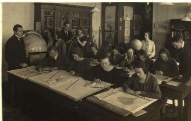
Praktiskie darbi fiziskajā ģeogrāfijā Matemātikas un dabaszinātņu fakultātē. 1926. gads.

Godinot Latvijas Universitāti 93. jubilejā, LU Bibliotēka ir atklājusi ceļojošo izstādi "Pēc septiņiem mirkļiem 100 gadi". Studentu un mācībspēku ikdienas un svētku mirkļus, kas atspoguļoti fotogrāfijās, konspektos, vēstulēs un citos materiālos, laika posmā no 1920. gada var iepazīt līdz 14. oktobrim LU galvenajā ēkas (Raiņa bulvāris 19) 2. stāvā, pie ieejas Lielajā aulā. Vēlāk, līdz pat 2012./2013. mācību gada beigām izstāde būs apskatāma visās LU fakultāšu ēkās.