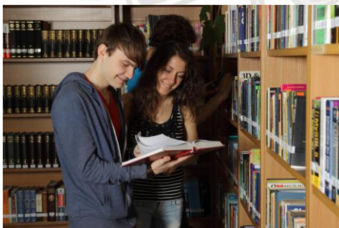
Studenti LU Bibliotēkas Daudznozaru bibliotēkā. 2012.

LU Bibliotēka aicina piedalīties elektroniskā aptaujā "Latvijas Universitātes Bibliotēkas brīvpieejas krājums", lai uzzinātu Jūsu domas par vienpadsmit nozaru bibliotēku darbu, bet īpaši par bibliotēku, kas atrodas tās fakultātes ēkā, kurā Jūs studējat. Jūsu viedokļi palīdzēs uzlabot krājuma organizāciju.