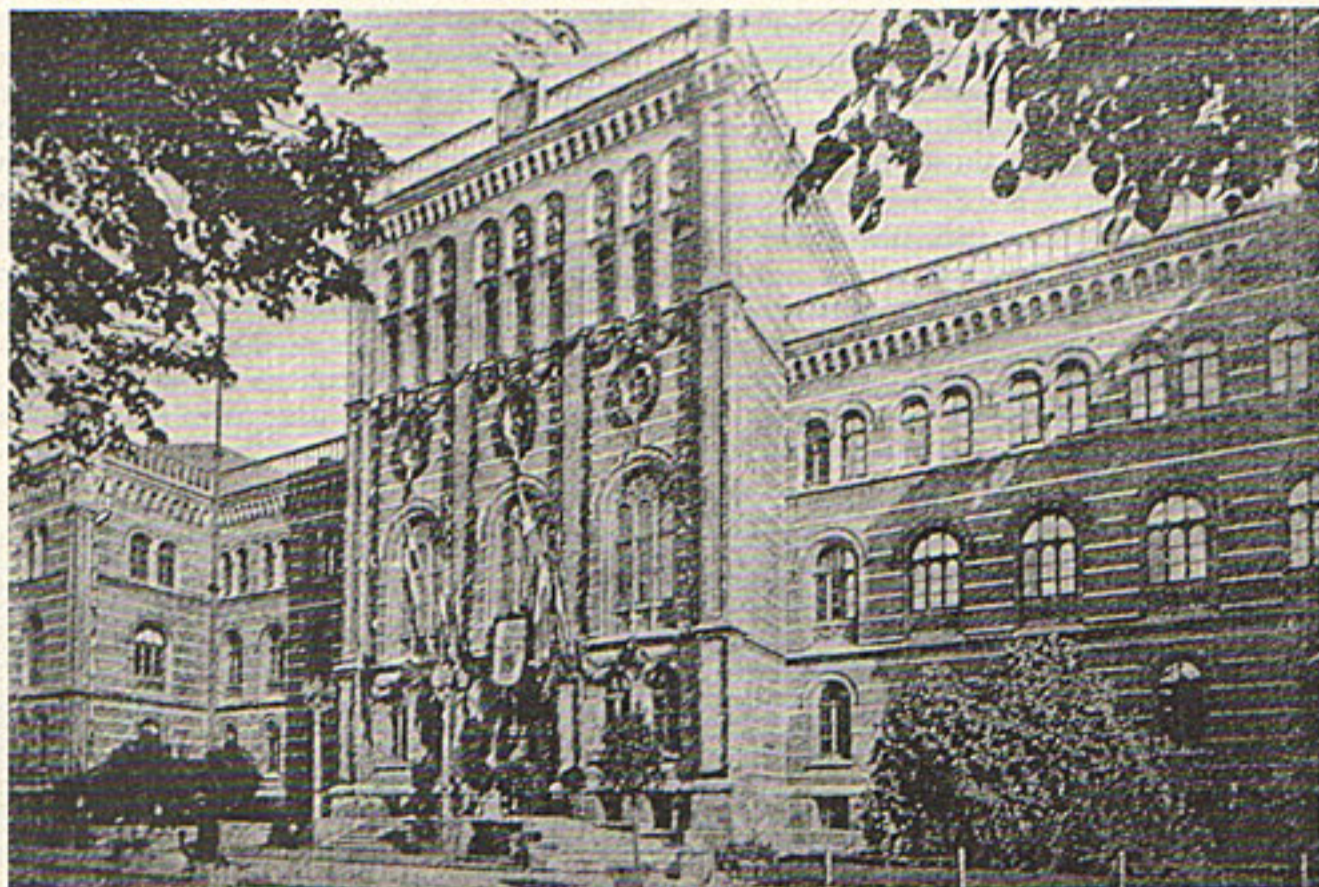
Karogiem un vītnēm pušķotā Latvijas Universitāte 1919. g. 28. septembrī

tiski apsprieda jautājumu, uz kādiem pamatiem būtu jānostāda augstākā izglītība autonomā Latvijā un atrada par nepieciešamu dibināt Rīgā autonomu augstskolu ar neierobežotu mācības brīvību, kuŗa apmierinātu dažādas dzīves prasības un pie tam veicinātu arī zinātni un kuŗa bez parastām universitātes fakultātēm ietilptu arī tehniskās, kā arī paidagoģiskais, farmaceitiskais un veterinārmedicīniskais institūti. Manāmi tālāk virzīts tika šis darbs 1919. gada vasarā Rīgā. Tad, lai gan Latvijas valsts nākotni vēl nevarēja uzskatīt par pilnīgi nodrošinātu, latviešu sabiedrībā radās ciets lēmums dibināt šādu augstskolu un sabiedrībā un valdības aprindās dzīvi tika apspriesti uz universitāti attiecošies jautājumi. Pamats Latvijas Universitātes tiesiskai pastāvēšanai tika likts ar Pagaidu Valdības 1919. gada 2. augustā izdoto rikojumu, ar kuŗu bijušais Rīgas Politehniskais Institūts pārgāja valdības rīcībā un viņa reorganizēšanai tika iecelta reorganizācijas komisija. Mēnesi vēlāk, 1919. gada 1. septembrī reorganizācijas ko-