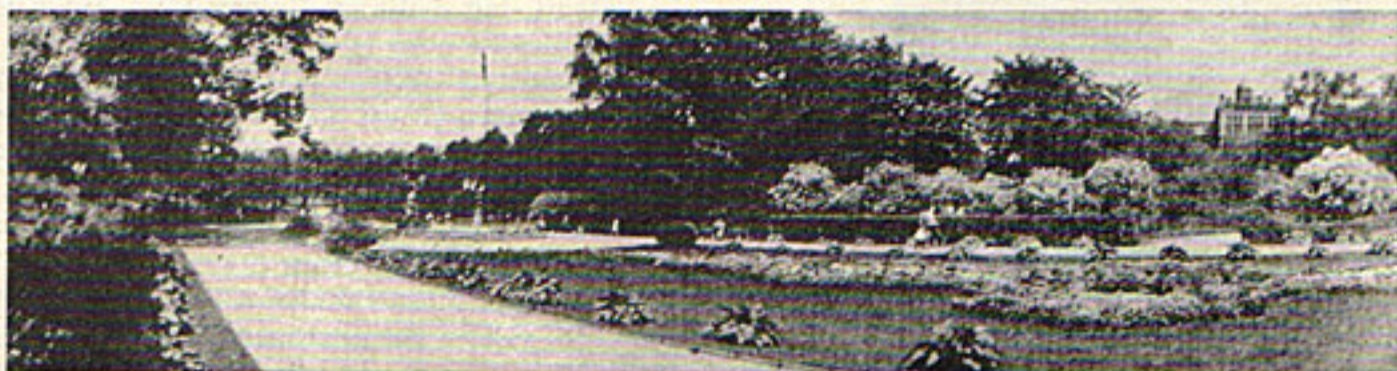
Latvijas Universitātes situācijas kopainava. Apstādījumos pa kreisi Brīvības piemineklis, pa labi Universitātes vecā ēka Raiņa bulvārī.

Tālāk, pārrunājot pirmā zinātniskā grāda nosaukumu, izglītības komisijā, pretēji universitātes padomes uzskatam, uzvarēja vienības princips, t. izglītības komisija atrada par vajadzīgu, lai tāpat kā otrais zinātniskais grāds visās fakultātēs ir doktors, būtu arī pirmais zinātniskais grāds, kas arī aptvertu visas fakultātes. Universitāte, kā jau teicu, šinī ziņā pielaiž dažādību. Humānitarās fakultātēs pirmo zinātnisko gradu sauca par kandidāta gradu, kamēr tehniskajās: arhitektūras — par arhitektu, inženieru — par inženieri, agronomijas — par agronomu u. t. t. Nepatika izglītības komisijai arī nosaukums kandidāts un — pieslienoties Parīzes universitātes pirmam zinātniskajam gradam „licencié“, Somijas universitātes zinātniskam gradam „licenciāts“ bez tam, kā liekas, šie grādi tiek ievesti arī Polijas un