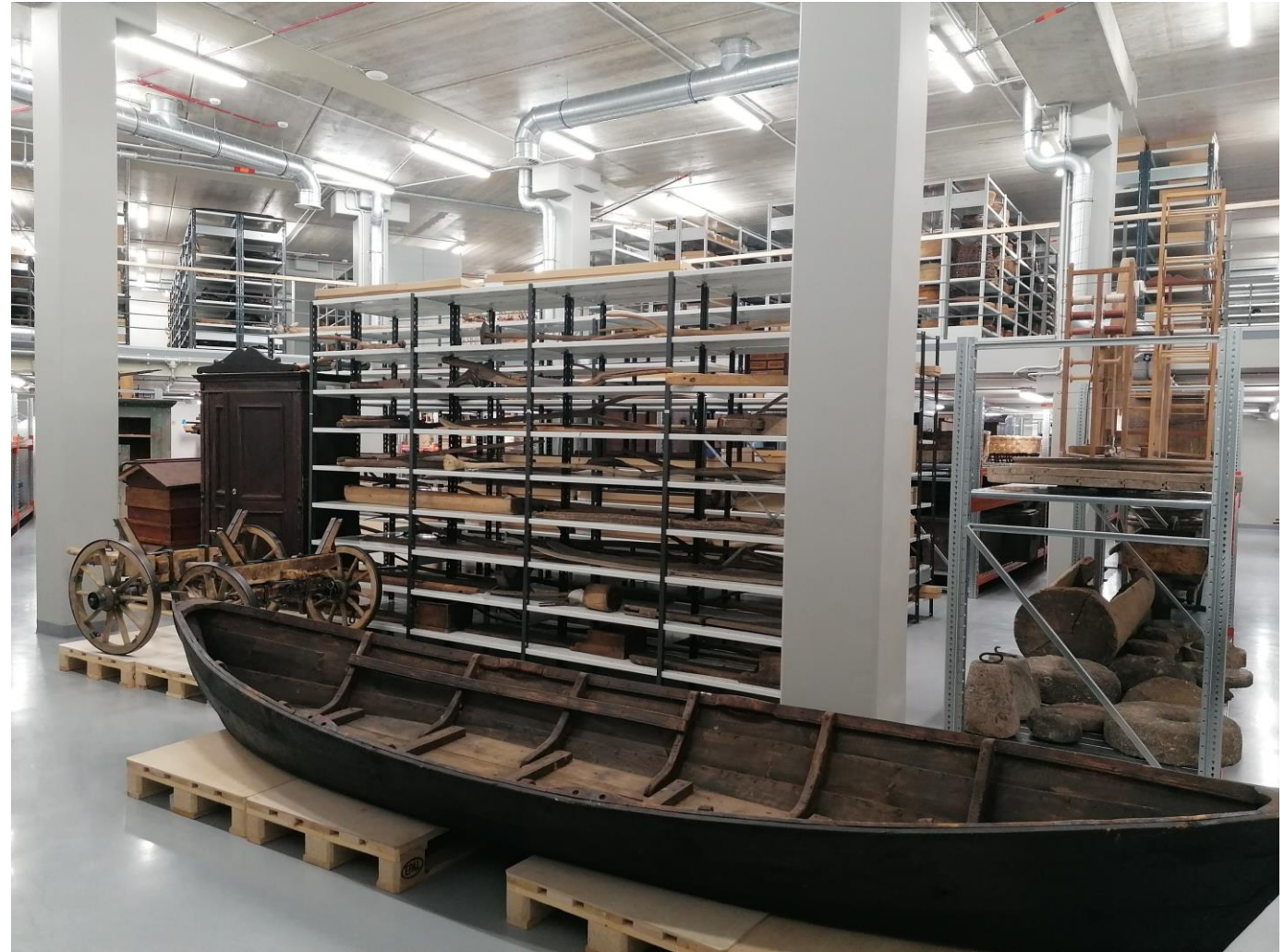
Latvijas Nacionālā vēstures muzeja glabātavas Muzeju krātuvē Pulka ielā 8, Rīgā