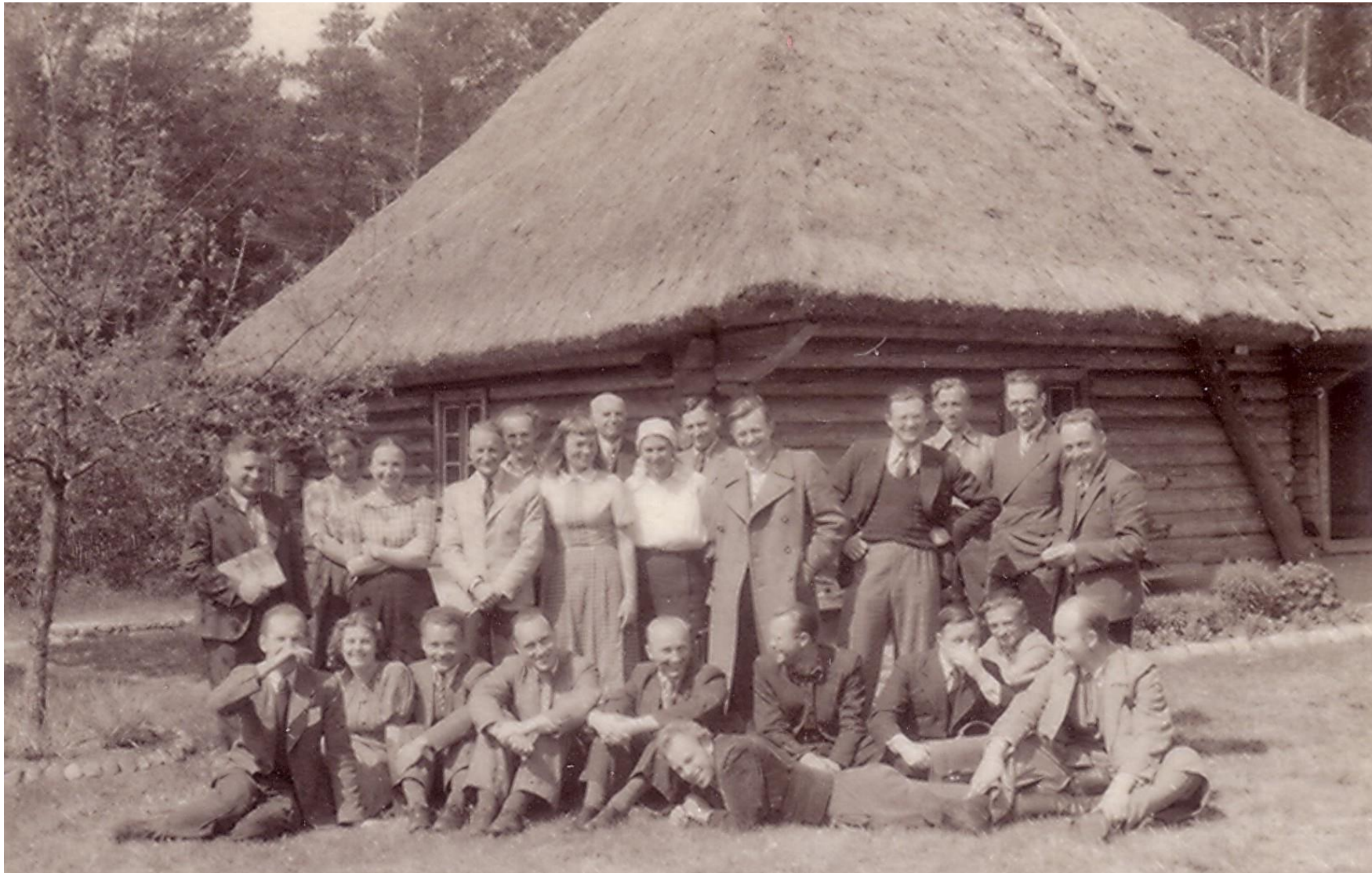
Pieminekļu valdes etnogrāfisko ekspedīciju dalībnieku sagatavošanas kursi Brīvdabas muzejā. 1942. gada maijs.