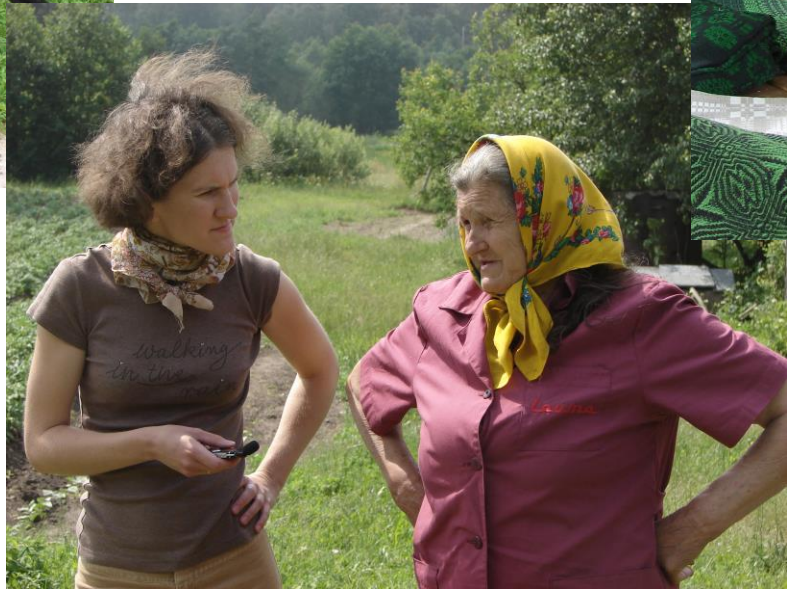
Latvijas Nacionālā vēstures muzeja Etnogrāfijas nodaļas ekspedīcija Rucavā 2007. un 2008. gadā.