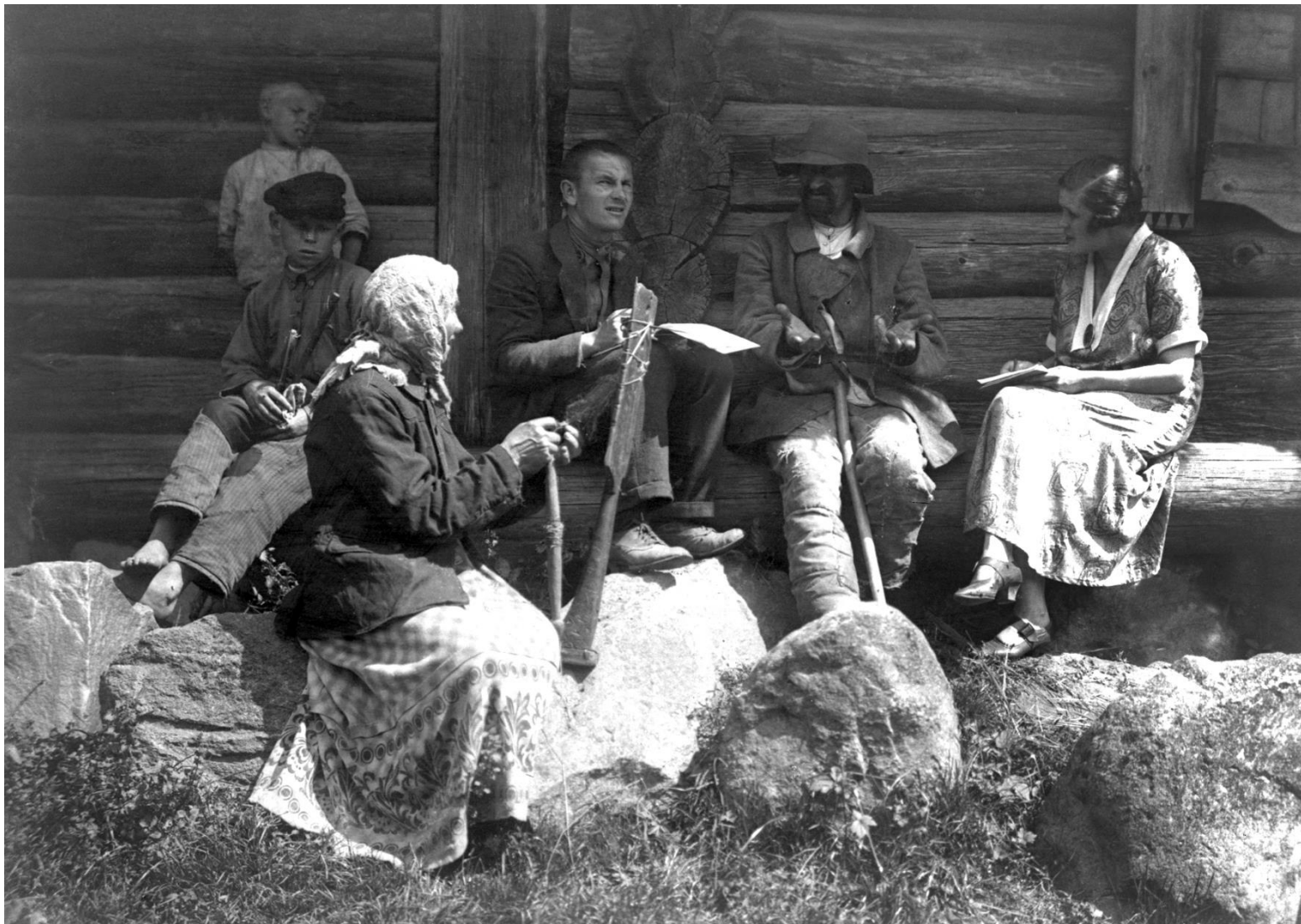
Pieminekļu valdes Etnogrāfiskās ekspedīcijas dalībnieki izjautā iedzīvotājus Rēzeknes apriņķa Andrupenes pagastā. 1925. gads.