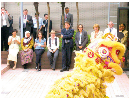
Vērojot Lauvas deju Starptautiskās skolēnu sasniegumu novērtēšanas asociācijas (IEA) 48. Ģenerālās Asamblejas sēžu starpbrīdī Honkongas universitātē 2007. gadā