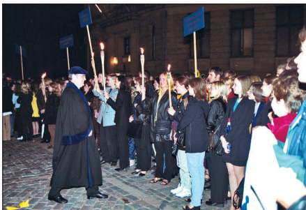
Aristoteļa svētkos ar fakultātes jaunojiem studentiem