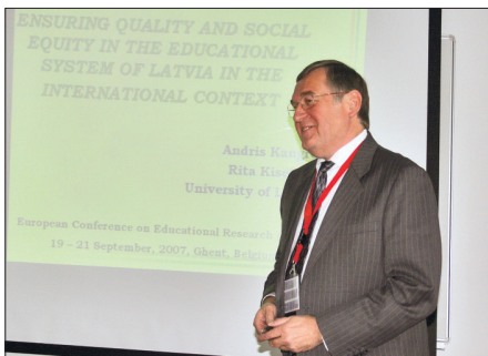
Uzstāšanās ar referātu Eiropas izglītības pētniecības asociācijas gadskārtējā konferencē Gentes universitātē Beļģijā, 2007. gadā