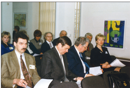
Darbs konferencē Rīgā