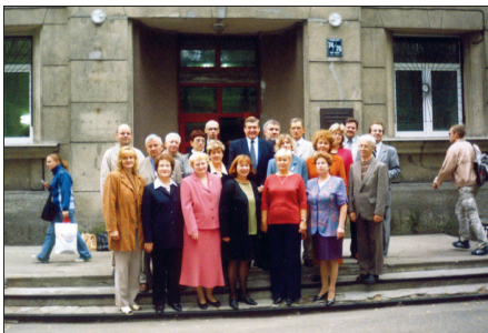
Kopā ar Pedagoģijas un psiholoģijas fakultātes profesoriem un asociētajiem profesoriem 2003. gadā