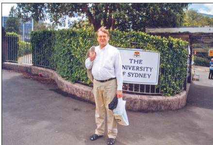
Ar tikko iegādātām grāmatām Sidnejas universitātē 2003. gadā