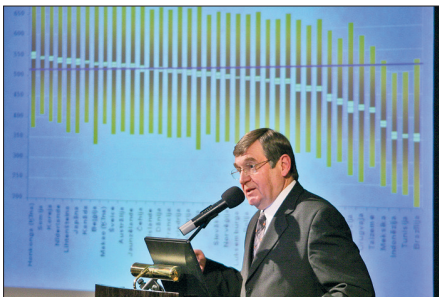
Ziņojot par OECD Starptautiskās skolēnu sasniegumu novērtēšanas programmas rezultātiem Latvijā 2004. gadā