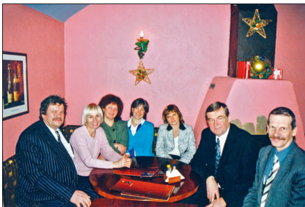
Kopā ar pētnieku grupu un ekspertiem pēc OECD Starptautiskās skolēnu sasniegumu novērtēšanas programmas rezultātu paziņošanas 2004. gadā