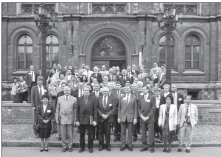
Kopā ar vairāk nekā 40 valstu pārstāvjiem Starptautiskās izglītības sasniegumu novērtēšanas asociācijas (IEA) 36. Ģenerālajā Asamblejā Rīgā 1995. gadā