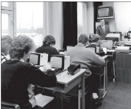
Nodarbtībā ar studentiem 80. gados