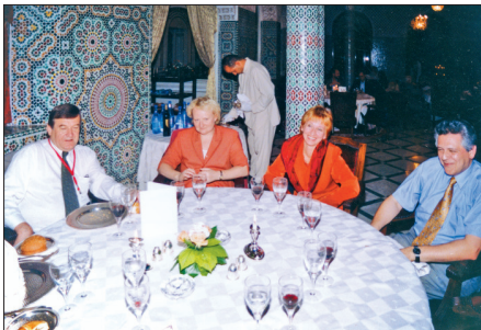
Kopā ar Slovērijas un Ungārijas pārstāvjiem Starptautiskās skolēnu sasniegumu novērtēšanas asociācijas (IEA) 43. Ģenerālajā Asamblejā Marakešā Marokā