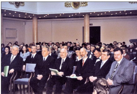
Kopā ar premjerministru A. Bērziņu, rektoru I. Lāci un kolēģiem IEA matemātikas un dabaszinātņu izglītības kvalitātes pētījuma (TIMSS) rezultātu paziņošanā 2000. gadā