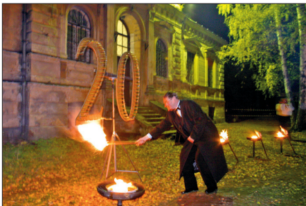
Zīmes aizdegšana fakultātes 20 gadu jubilejas svētkās 2003. gadā