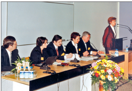
Valsts prezidente V. Viķe-Freiberga konferences atklāšanā Pedagoģijas un psiholoģijas fakultātē