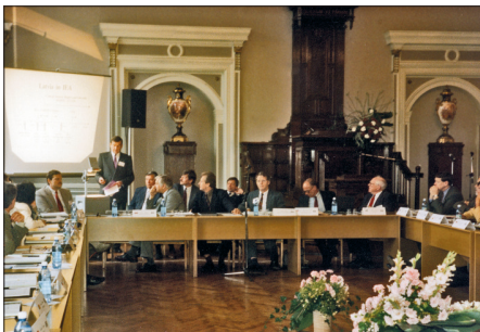
Uzstājoties Starptautiskās izglītības sasniegumu novērtēšanas asociācijas (IEA) 36. Ģenerālajā Asamblejā Rīgā 1995. gadā