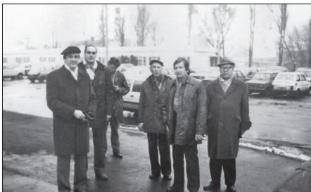
Kopā ar Latvijas Universitātes kolēģiem no delegācijas sadarbības līguma parakstīšanai ar Šecinas universitāti Polijā 80. gados