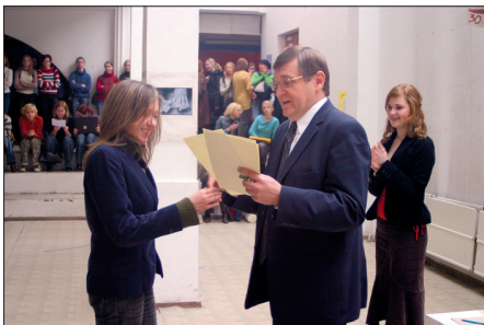
Sveicot studentu pašpārvaldes dalībniekus 2006. gadā