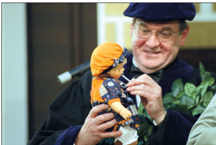
Prieks par dāvanu fakultātes jubilejā 2003. gadā