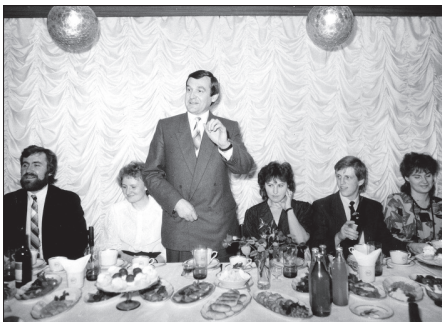
Informātikas pamatu un tehnisko mācītājdzēkļu katedras 5 gadu jubilejas svinībās 1991. gadā