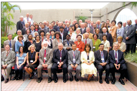
Kopā ar Starptautiskās skolēnu sasniegumu novērtēšanas asociācijas (IEA) 48. Ģenerālās Asamblejas dalībniekiem Honkongas universitātē 2007. gadā