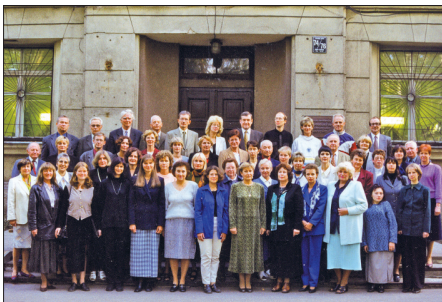
Kopā ar Pedagoģijas un psiholoģijas fakultātes kolēģiem