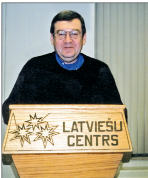
Uzstājoties Latviešu centrā Toronto 2001. gadā